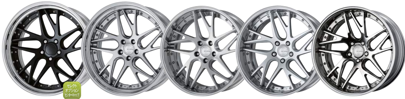
マットブラック (MBL) (ディープコンケイブ) STEP RIM 21, コンボジットハブブラッシュド (P8U) (ミドルコンケイブ) STEP RIM 21, ブラッシュド (BRU) (ミドルコンケイブ) 20, マットシルバー (MSL) (ディープコンケイブ) 20, ハブフィニッシュ (PP2) (ディープコンケイブ) 20

Coming Soon 開発中の為、仕様を予告無く変更する場合があります。 ※ 21inch STEP RIM / 20inch 除く